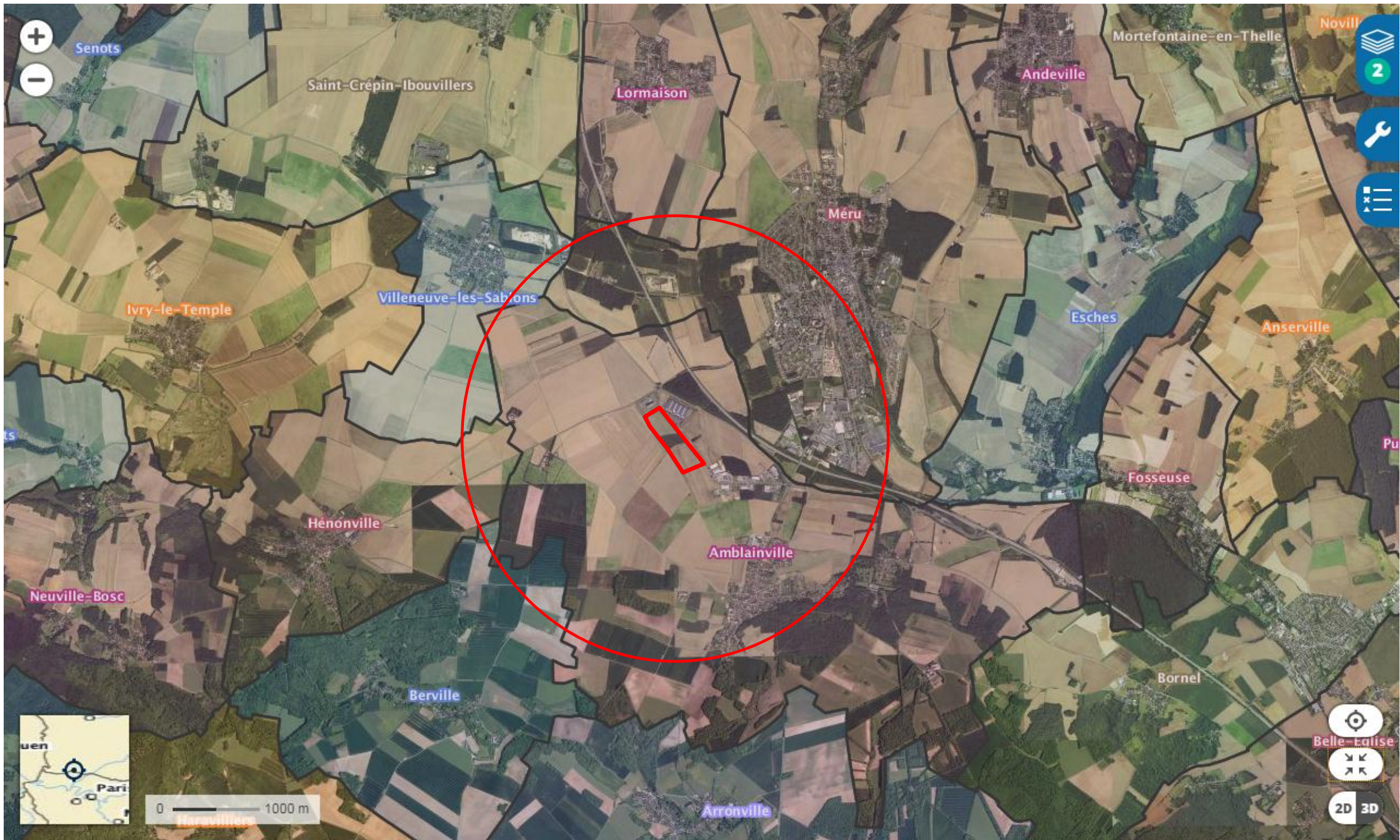
Zone d'affichage de l'enquête publique Rayon 2 Km